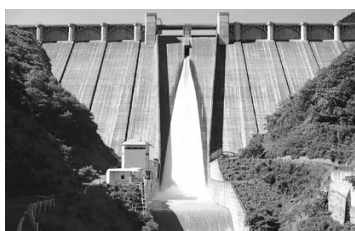
浦山ダムも通ります♪

5月下旬～6月上旬は、そばの花と新緑が相まった美しい景色に癒やされること間違いありません。また、サイクリング中に食べるそばのおいしさは格別です!